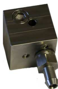
Les blocs "Ever Ready"